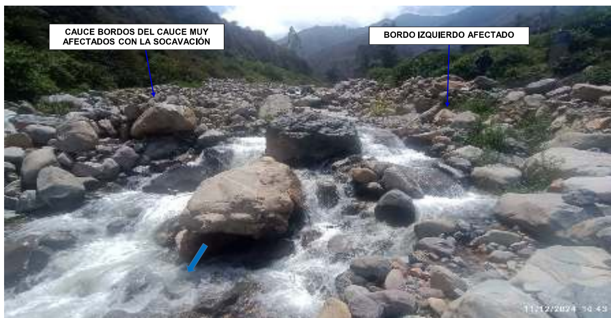
FIGURA N°02: CAUCE COLMATADO CON FLUJO DE DETRITOS Y ROCAS DE DIFERENTES TAMAÑOS, BORDOS DEL CAUCE SE ENCUENTRAN AFECTADOS POR SOCAVACIÓN PONIENDO EN RIEGO A DESBORDE EN EL PUENTE HACIA LA COMUNIDAD LA PERLA CHAUPIS.