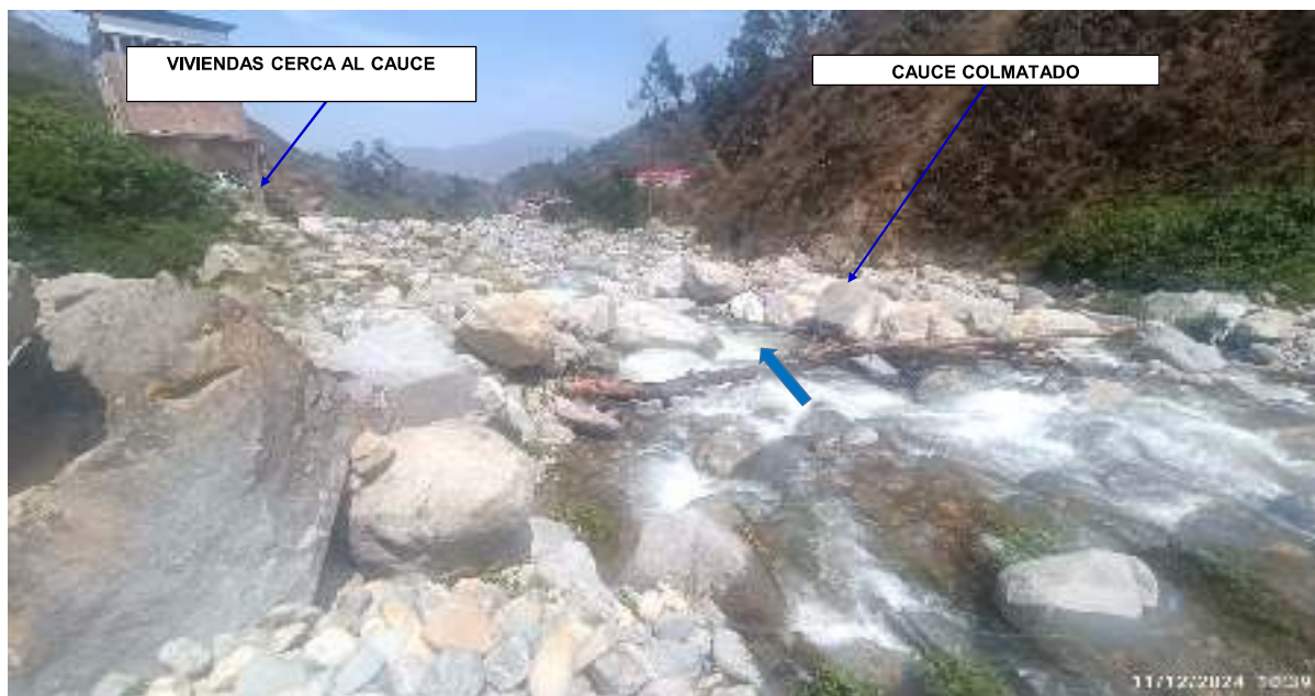
FIGURA N°01: UBICACION DEL RÍO AÑASMAYO QUE SE ENCUENTRA COLMATADO A LA ALTURA DEL PUENTE LA PERLA, DISTRITO DE ATAVILLOS BAJO Y SUMBILCA, PROVINCIA DE HUARAL - LIMA.