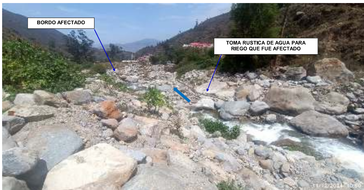
FIGURA N°03: TRAMO DEL RÍO AÑASMAYO SE ENCUENTRA COLMATADO CON MATERIAL FLUJO DE DETRITOS Y ROCAS, QUE PONE EN PELIGRO A LAS VIVIENDAS, PUENTE LA PERLA Y UNA TROCHA CARROZABLE.