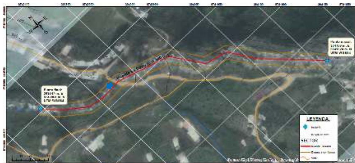
5.- IMAGEN SATELITAL DE ZONA VULNERABLE