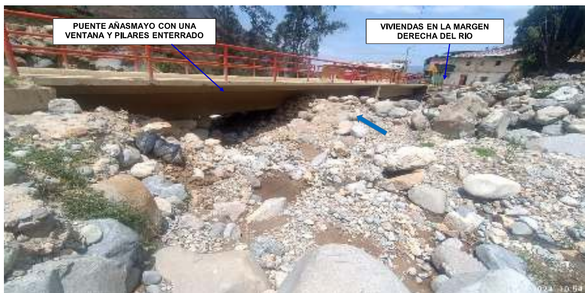
FIGURA N°04: PUENTE LA PERLA CON UNA VENTANA COLMATADO CON FLUJO DE DETRITOS Y ROCAS, PUDIENDO SER AFECTADO EN AUMENTO DE CAUDALES SIENDO UN RIESGO LATENTE HACIA LAS VIVIENDAS DE LA COMUNIDAD CAMPESINA LA PERLA CHAUPIS, AREAS DE CULTIVO, UN CANAL DE RIEGO Y POSTES DE ALIMBRADO PÚBLICO.